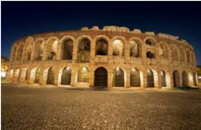
L'Arena di Verona simbolo della città.

La città rappresenta quindi il luogo ideale nel quale dibattere lo Sviluppo Sostenibile del Paese e dell'importante contributo che, l'Industria Chimica con i suoi processi, prodotti e tecnologie può offrire ai settori manifatturieri, agli utilizzatori finali e ai consumatori.