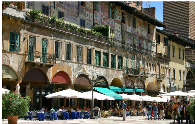
Piazza delle Erbe uno dei luoghi più caratteristici di Verona.